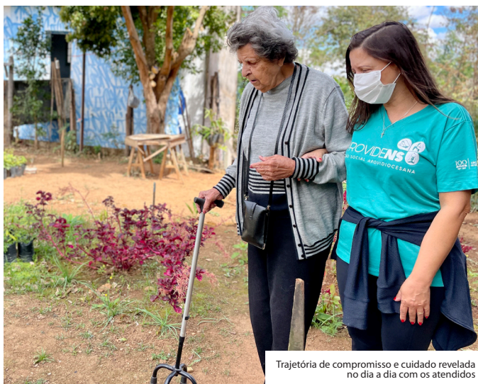
Trajétoria de compromisso e cuidado revelada no dia a dia com os atendidos