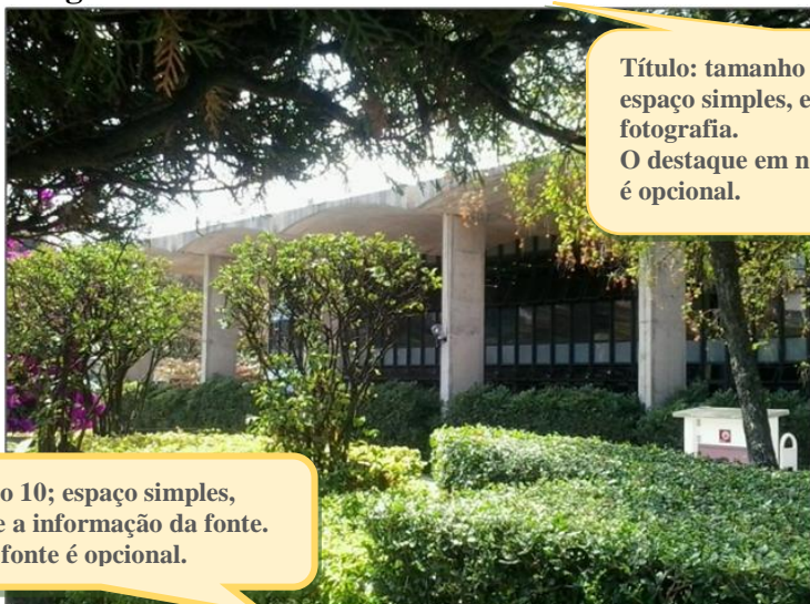
Imagem 1 - Biblioteca da PUC Minas

Título: tamanho da fonte 12; espaço simples, entre o título e a fotografia. O destaque em negrito nos títulos é opcional.