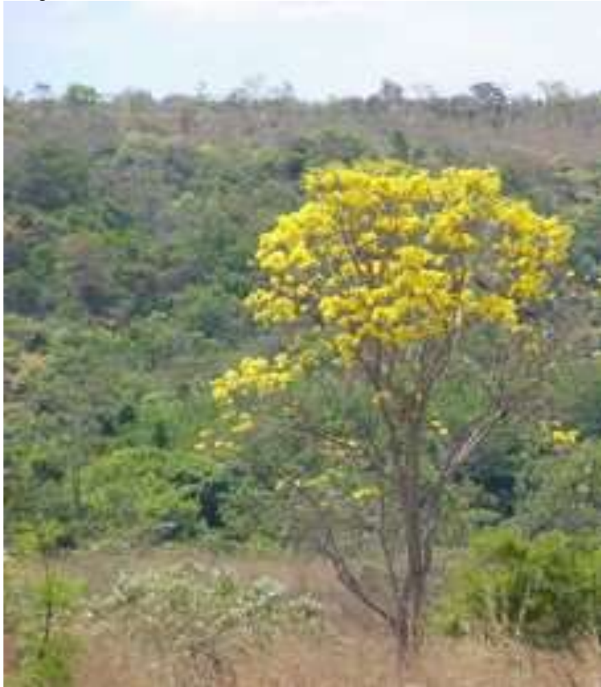
Imagem 1 – Bioma Cerrado