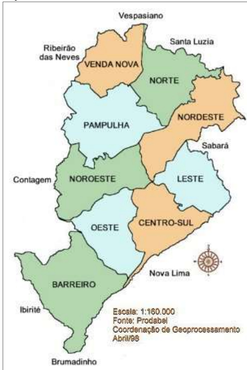
Mapa 1 - Distritos Sanitários de Belo Horizonte